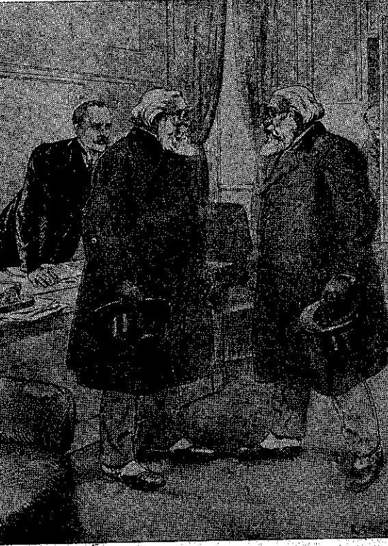
Ἐκαστον τελείως τοὺς δύο Δεγίστ... (Σελ. 62, στ. α')

— Ἄχ! ἂν μπορούσε νὰ μᾶς πιάσῃ τοὺς Πλόκ, πῶς τρεῖς μῆνες τώρα μᾶς γλυστροῦν ἀπ' τὰ χέρια. — Σοῦ λέω, Λαρόζ, ὅτι θὰ τὸ κάμῃ. Τῆ στιγμῆ ἐκείνῃ ὁ θυρωρὸς εἰσῆλθε 'στὸ γραφεῖο καὶ μὲ ὕφος ἡλιθίου ἀνήγγειλε: — Ὁ κ. Δεγίστ, βουλευτής!