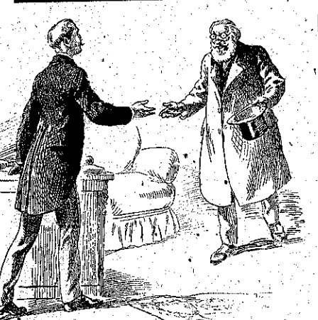
Ἄ! Δεγίστ, παλιέ μου φίλε... (Σελ. 61, στ. α')

ΕΡΒΕΛΙΝ ΚΑΤΑ ΠΛΟΚ ΑΣΤΙΝΟΜΙΚΟΝ ΜΥΘΙΣΤΟΡΗΜΑ (Συνέχεια ἴδε σελ. 56) Ὁ Ἐρβελίν ἀνεχώρησεν ἐνθουσιασμέ-νος. Αὐτὴ τῆ φορὰ τοῦλάχιστον ἔτριβε τὰ χέρια του.