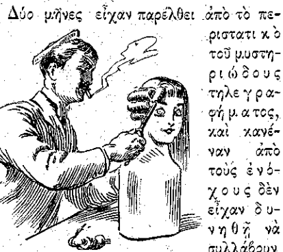
«Περνοῦσε τῆς ὥρας τῆς σχολῆς του κατασκευάζων περρουδίες...» (Σελ. 56, στ. α')

Δύο μῆνες εἶχαν παρελθεῖ ἀπὸ τὸ περιστατι κὸ τοῦ μυστηριώδους τηλεγραφήματος, καὶ κανέναν ἀπὸ τοὺς ἐνόχους δὲν εἶχαν δυνήθῃ νὰ συλλάβουν.