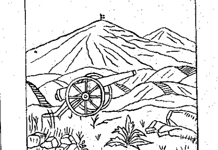
Ἰδοῦ τὸ τηλεδῶλον. Ποῦ εἶνε ὁ πυροβολητής;